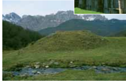
Túmulo de Vegabaño