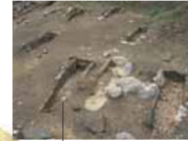
Necrópolis de El Barrejo

En el valle de Valdeón destacan Soto de Valdeón con la iglesia de San Pedro del s. XVI por su bóveda de crucería y el retablo renacentista, y la ermita dedicada a la Virgen Blanca , y también Posada , con una iglesia de los s. XVI y XVII, dedicada a Santa Eulalia .