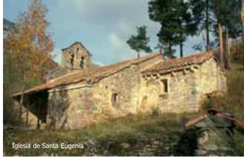
Iglesia de Santa Eugenia

Vegacemeja posee una iglesia de traza románica bastante remodelada, con la espadaña separada del resto del edificio, aunque lo más llamativo son las pinturas murales del s. XVI. Burón es un pueblo reconstruido en gran medida. Sobresale el Palacio de los Gómez Caso , renacentista, a imitación de las casonas asturianas, en tanto que el de los Allende , levantado a principios del s. XX, permanece desmontado a la espera de su ubicación definitiva. En Acebedo la torre campanario de la iglesia se superpone a una fortificación medieval rodeada por un foso anular.