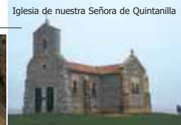
Iglesia de nuestra Señora de Quintanilla