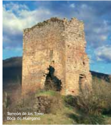
Torreón de los Tovar, Boca de Huérgano

La madera y la piedra son los protagonistas de un patrimonio arquitectónico del que todavía nos quedan buenas muestras dispersas por el espacio protegido. El hombre supo adaptar estos materiales que proporcionaba el medio a los usos tradicionales, a un clima duro y a un relieve accidentado, caracterizando así una tipología constructiva especial. Desde hace pocas décadas, los nuevos materiales y la posibilidad de trasportarlos sin excesivo esfuerzo al último rincón de estas montañas ha transformado el paisaje urbano de forma notable.