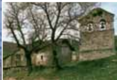
Iglesia de Santa Águeda. Frescos y espadaña

Nuestra Señora de Santa María, conocida también como la catedral de la montaña