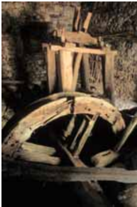
Interior del batán de Espejos de la Reina

La madera y la piedra son los protagonistas de un patrimonio arquitectónico del que todavía nos quedan buenas muestras dispersas por el espacio protegido. El hombre supo adaptar estos materiales que proporcionaba el medio a los usos tradicionales, a un clima duro y a un relieve accidentado, caracterizando así una tipología constructiva especial. Desde hace pocas décadas, los nuevos materiales y la posibilidad de trasportarlos sin excesivo esfuerzo al último rincón de estas montañas ha transformado el paisaje urbano de forma notable.