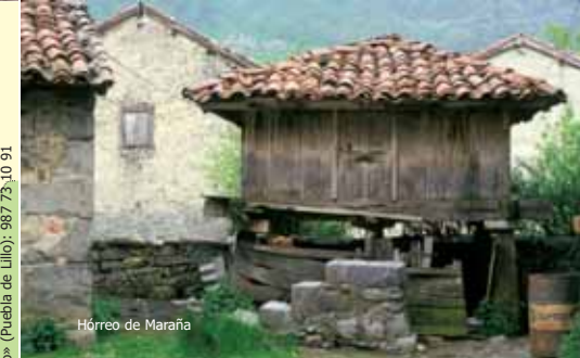
Hórreo de Maraña

Otras construcciones de interés son los molinos y batanes . Se trata igualmente de edificios de pequeñas dimensiones y de planta rectangular. La propiedad por lo general solía estar dividida entre varios vecinos, que compartían la molienda por riguroso turno. En su mayoría son molinos rastreros —que funcionaban sólo en determinadas épocas de año, según el caudal— y de una sola muela. Recientemente se ha reconstruido el molino de Vegacarneja.