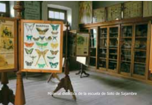
Material didáctico de la escuela de Soto de Sajambre