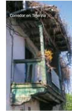
Corredor en Tejerina

El rasgo más destacado de la arquitectura popular es la primacía de la piedra y de la madera. La primera se utiliza en forma de mampuestos en el aparejo de los muros, en tanto que la madera adopta formas artísticas en los balaustres de los corredores, a la vez que puede constituir por sí misma el elemento básico en el caso de los hórreos. Las cubiertas de cuelmos de centeno han sido sustituidas por las de teja.