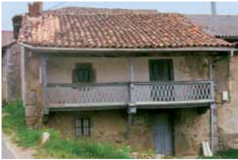
Casa con corredor en Vegacarneja

La vivienda propiamente dicha consta de dos plantas. La pieza fundamental es la cocina, con el hogar formado por losas de piedra en torno al cual se dispone el escaño. Aquí se sitúa también el horno para cocer el pan, que suele estar situado en una de las esquinas. En la planta superior se encuentran los dormitorios, abiertos a la fachada, en la que sobresale el corredor de madera, generalmente resguardado por prolongaciones de los muros de ambos costados.