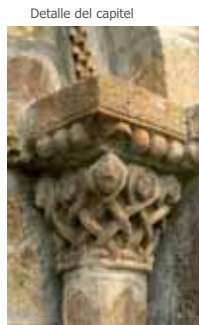
Detalle del capitel