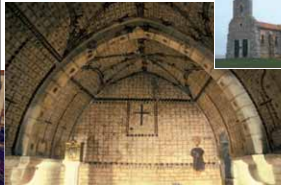
Iglesia de La Puerta. Pinturas del ábside