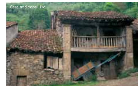
Casa tradicional. Pío

Los batanes o pisones son unos mecanismos de fundamento hidráulico, que se alojaban en edificios de arquitectura similar a los molinos. Contaban con gruesos mazos de madera movidos por un eje horizontal, destinados a golpear y desengrasar los tejidos una vez confeccionados en el telar, con el fin de darles apresto. En la actualidad únicamente se conserva en pie el de Espejos de la Reina.