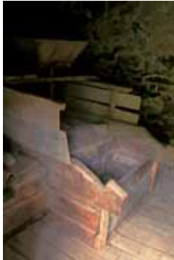
Tolva del molino Tarandín, en Boca de Huérgano

La vivienda propiamente dicha consta de dos plantas. La pieza fundamental es la cocina, con el hogar formado por losas de piedra en torno al cual se dispone el escaño. Aquí se sitúa también el horno para cocer el pan, que suele estar situado en una de las esquinas. En la planta superior se encuentran los dormitorios, abiertos a la fachada, en la que sobresale el corredor de madera, generalmente resguardado por prolongaciones de los muros de ambos costados.