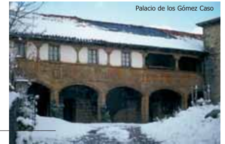
Palacio de los Gómez Caso

En Cordifianes , a pocos metros del cauce del río Cares en su margen derecha, se conserva el yacimiento arqueológico de El Barrejo , una necrópolis plenomedieval con tumbas de lajas y bloques de caliza, descubierta en 1995. Algo más abajo está la ermita de la Virgen de Corona , patrona del valle de Valdeón, donde la leyenda refiere que fue coronado rey don Pelayo.