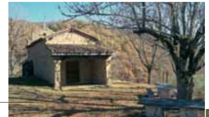
Ermita de la Virgen de Retejerina

Prioro cuenta con una iglesia del s. XVIII, barroca, y la ermita del Santo Cristo , también barroca aunque remozada, que ostenta sobre la puerta el escudo de los Prado, de Renedo de Valdetújar, con un león rampante. En Tejerina puede visitarse la ermita de la Virgen de Retejerina , obra atribuida al s. XIV, con reformas posteriores.